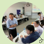
ラオス国立大学講義