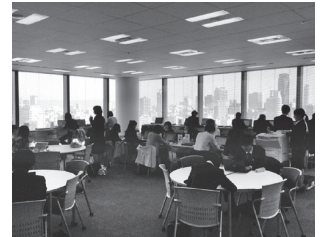
大阪梅田キャンパス