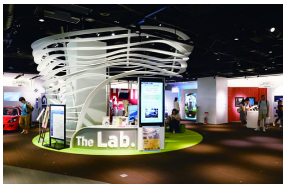
The Lab. みんなで世界一研究所