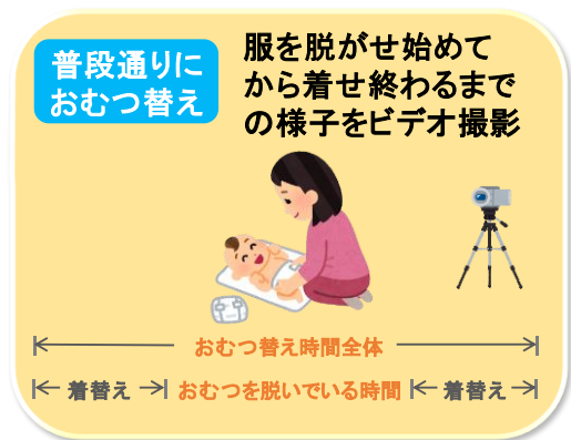
図1 おむつ替えをしている様子の行動観察

※3 Abidin博士により米国で開発された親の育児ストレスを測定するのに有効なツール。世界中で使用され、ストレス状態にある親子関係の早期発見や、ストレス軽減のための早期介入などに役立ちます。子どもの観点（子どもの特徴に関するストレス）と親の観点（親自身に関するストレス）からの質問項目で構成されており、5段階で答える形式になっています。