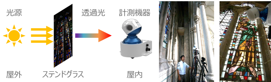
図 1 : 計測の様子