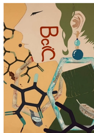
図 1. BciC 酵素の二重機能を擬人化したイラスト

このような生合成酵素の反応機構を解明していくことで、人工的に作製が困難な光捕集系のクロロフィル分子を容易に作製する手がかりになることが期待されます。