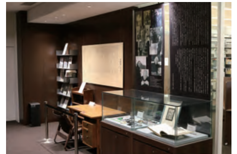
加藤周一文庫 常設展示