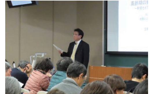
立命館土曜講座「金融ジェロントロジー」

の研究者、および研究活動の結節点となり、社会への運用を後押しする存在になること。さらには今後登場する新規の社会課題の解決に挑む若手研究者の育成と支援にも力を注いでいきます。