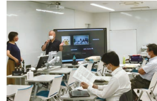
法政基盤研究センター研究会

21世紀になって急激に立ち現れてきた社会課題に対し、法と政治を中心に心理学や経済学など多様な学問分野が集結し、学際的に切り込んでいくところに本センターの独自性があります。どの学問分野であっても、研究成果を社会に実装していくためには法制度・政策の整備が欠かせません。目指しているのは、立命館大学のあらゆる分野