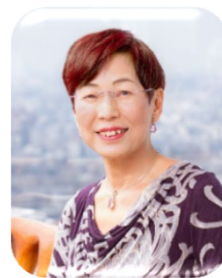
上野千鶴子氏