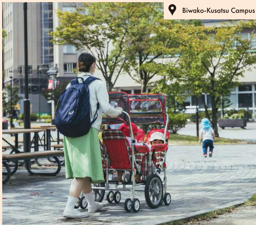
📍 Biwako-Kusatsu Campus