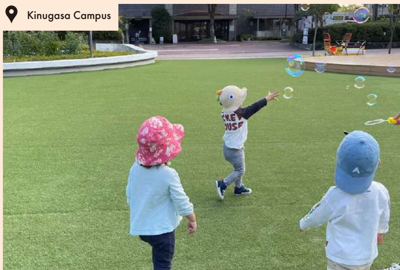
📍 Kinugasa Campus